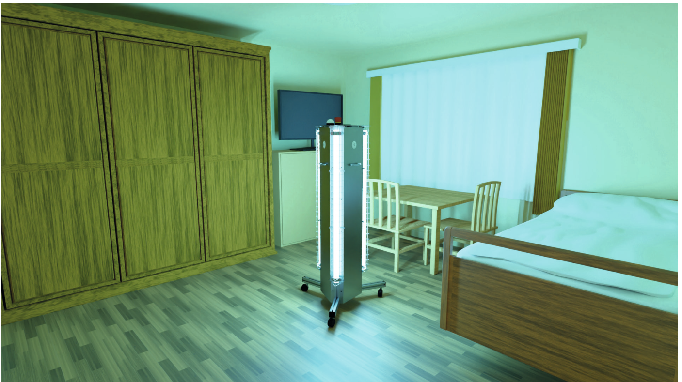
Bild Einsatz des HA-UV Raumdesinfektor 3D im Bewohnerzimmer eines Pflegeheimes