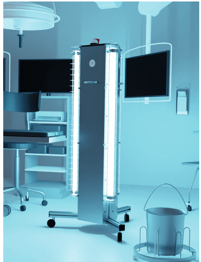
Bild Einsatz des HA-UV Raumdesinfektor 3D im OP-Saal