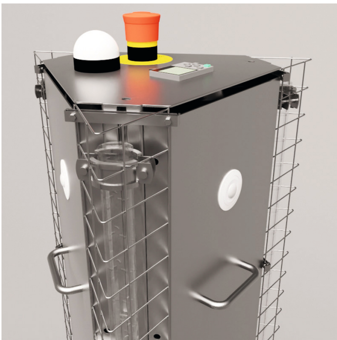
Bild HA-UV Raumdesinfektor 3D Detailansicht Oben