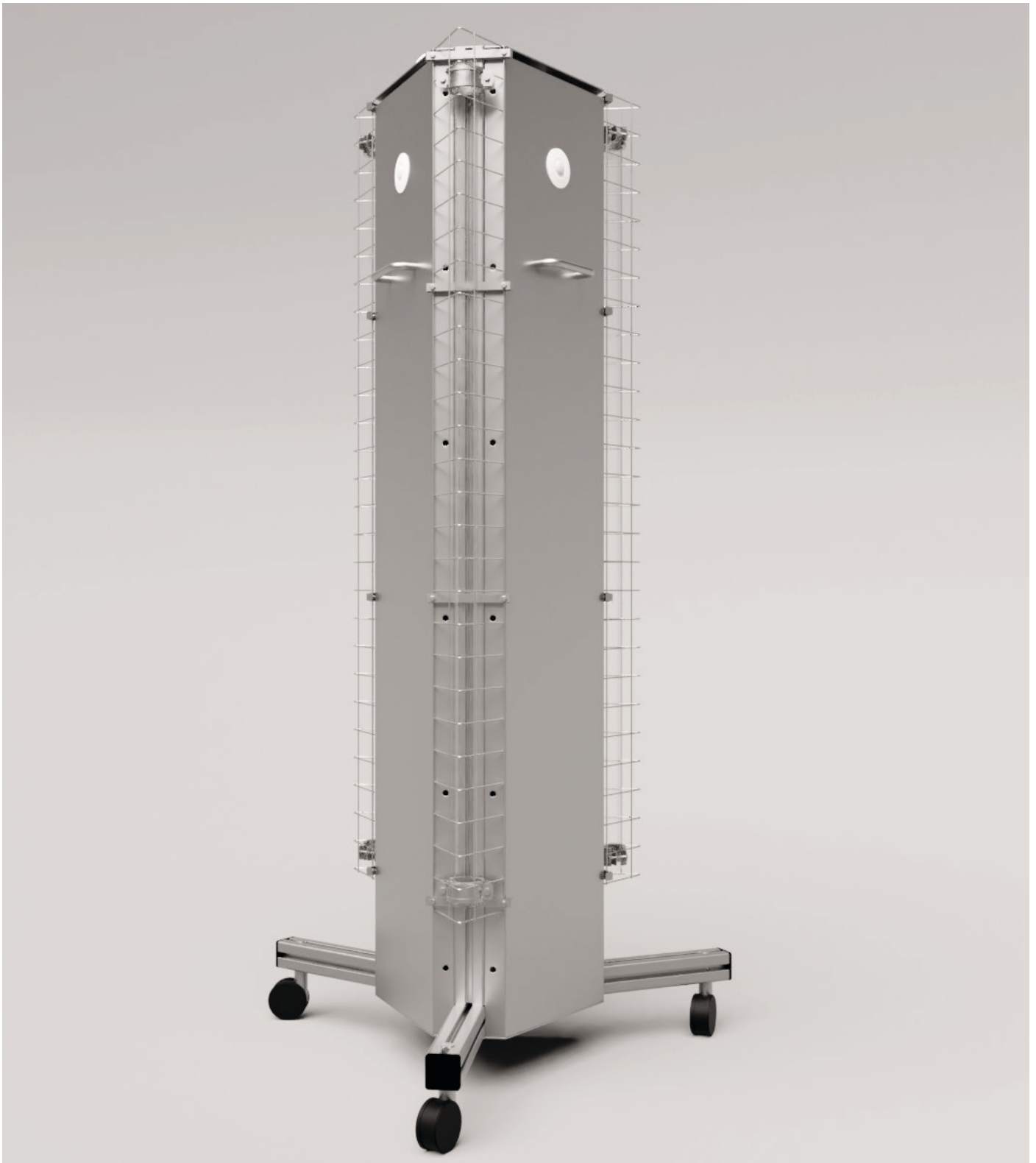
Bild HA-UV Raumdesinfektor 3D Großansicht