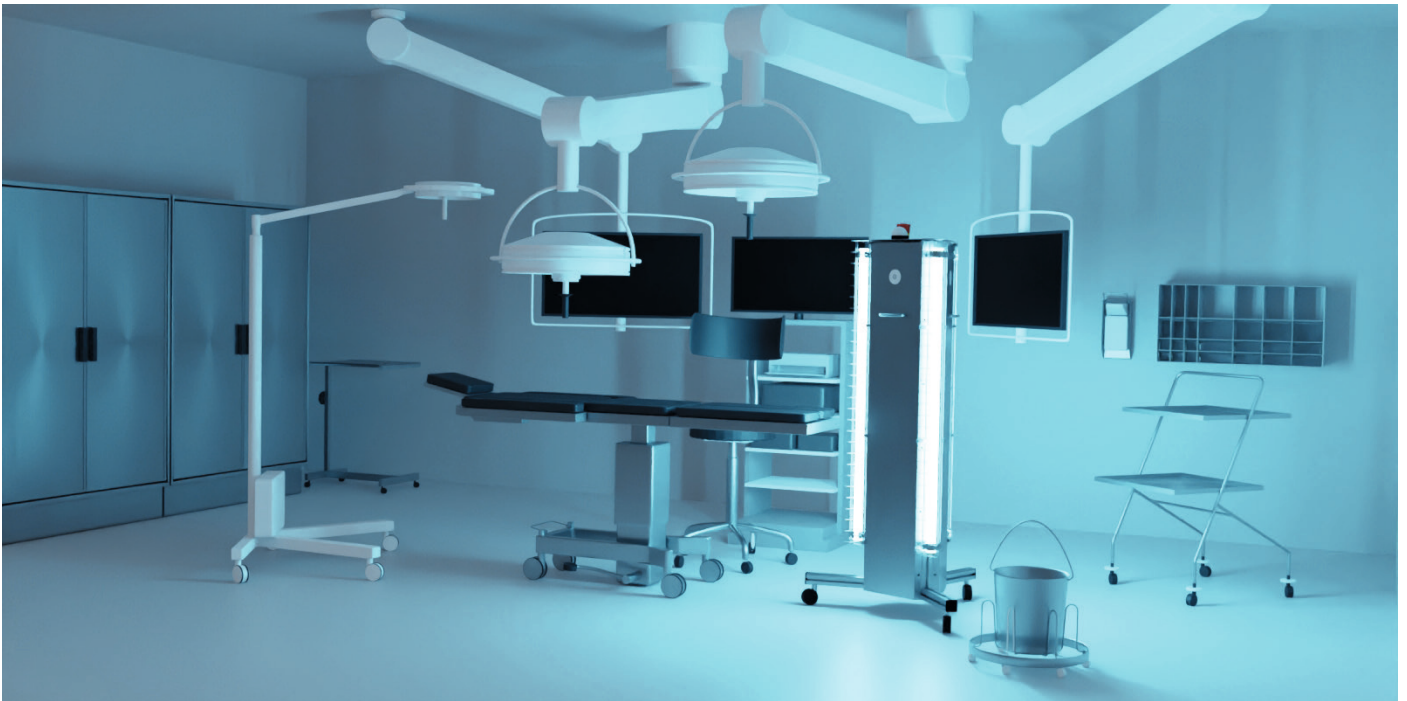
Bild Einsatz des HA-UV Raumdesinfektor 3D im OP-Saal