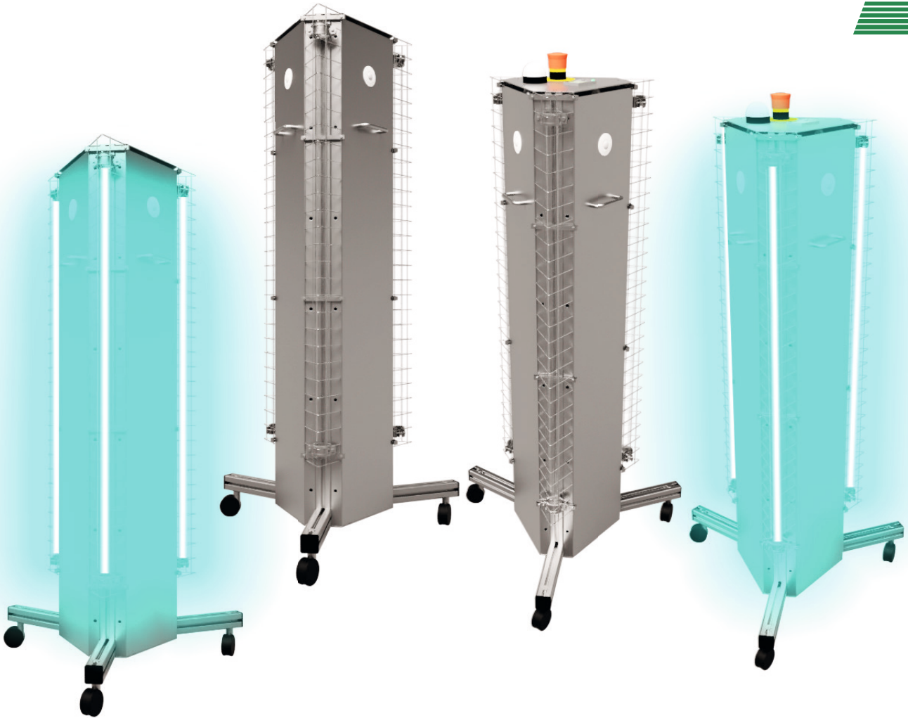
Bild HA-UV Raumdesinfektor 3D