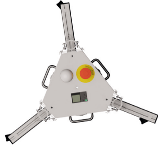
Bild HA-UV Raumdesinfektor 3D Ansicht von oben